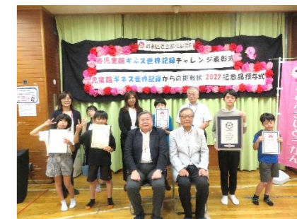
※撮影時のみ、マスクを外しています。