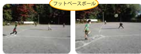
フットベースボール

感染症との共存は続きますが、子供達の充実した様子から館外活動の必要性が感じられました。