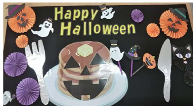
「よちよち」お昼寝アート