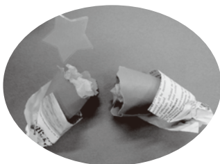
いもほりごっこあそび

今月は芸術の秋企画として、様々な製作のプログラムがあります。 児童館でいろいろな秋を作って楽しみましょう！