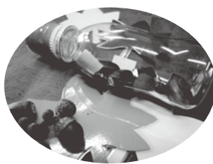
どんぐりのガラガラづくり