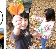
上野恩賜公園におでかけ