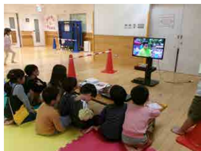
参加中の子供達の様子

また、12月のお楽しみ会でやりたいことについても考え、たくさんの遊びや工作などの意見が出ました。中には「こどもスタッフをやりたい」と手を挙げる子供もいました。年末に向けて子供達と準備を進めています。ぜひ遊びに来てください！