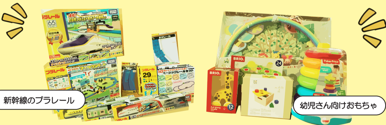
新幹線のプラレール

たくさんの新しいプラレールや、幼児さん向けのおもちゃが新しくはまりました! 図書室や遊戯室で遊ぶことができるので、ぜひ児童館に遊びに来て遊んでみて下さい!