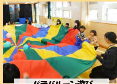
パラバルーン遊び

☆令和6年度幼児タイムプログラムの詳細は幼児タイムたより、または池之端児童館公式LINEの配信、台東区社会福祉事業団 ホームページからご確認ください。