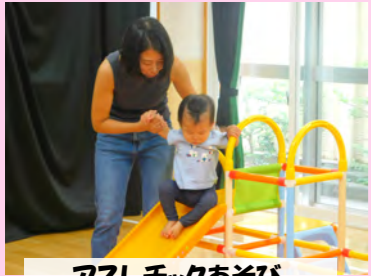
アスレチックあそび