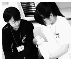
人形で抱っこ練習