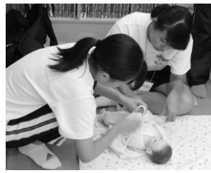
人形で着替え練習